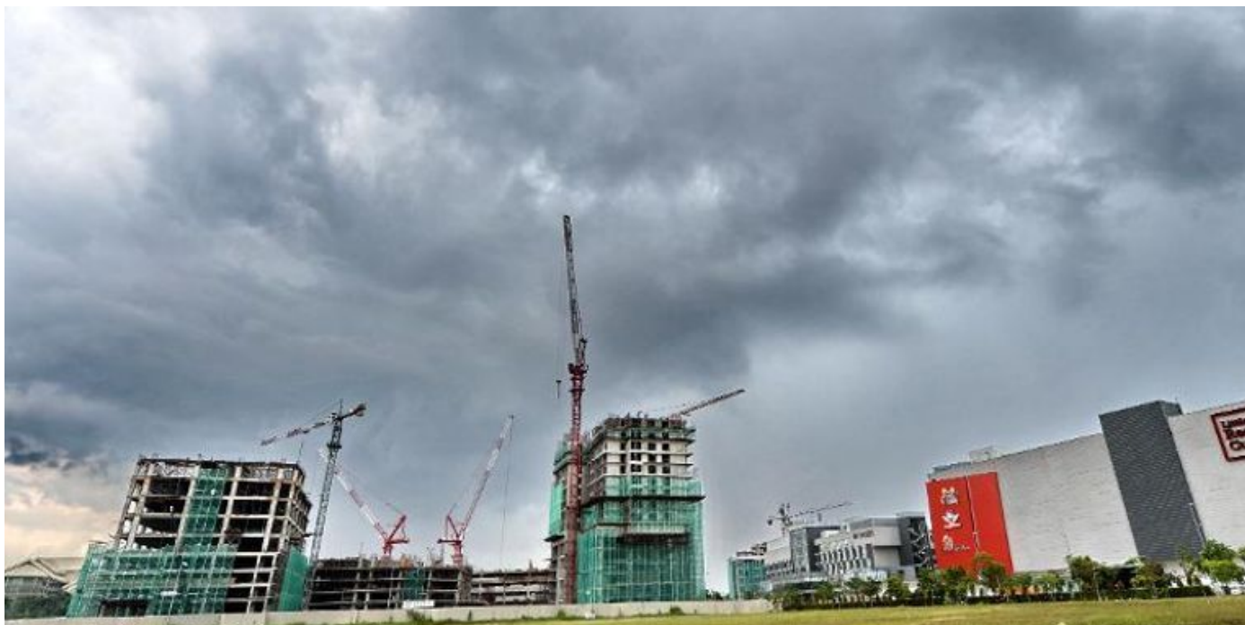
Bangunan-bangunan yang dalam proses pembinaan di zon pembangunan Iskandar di Johor.

Terkini Singapura Dunia Gaya Hidup Hiburan Eksklusif #beliasg Sukan