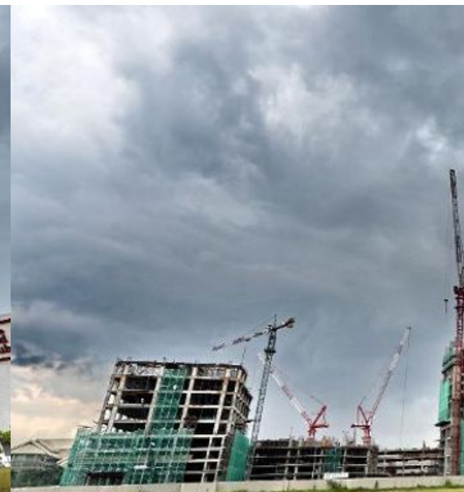
Bangunan-bangunan yang dalam proses pembinaan di zon pembangunan Iskandar di Johor.